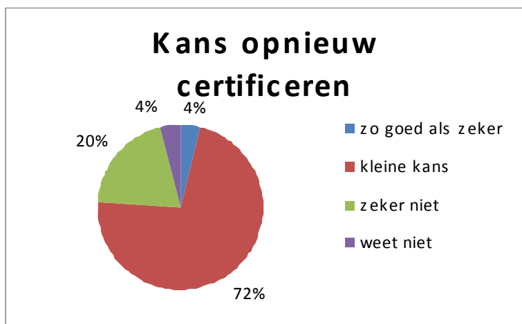
Grafiek 6 Kans op certificatie naar beëindiging

Aan de organisaties die op eigen initiatief zijn gestopt met ISO 14001-certificatie is de vraag gesteld hoe groot de kans is dat zij in de toekomst opnieuw gecertificeerd zullen worden. De kans hierop is bij de meeste bedrijven klein: