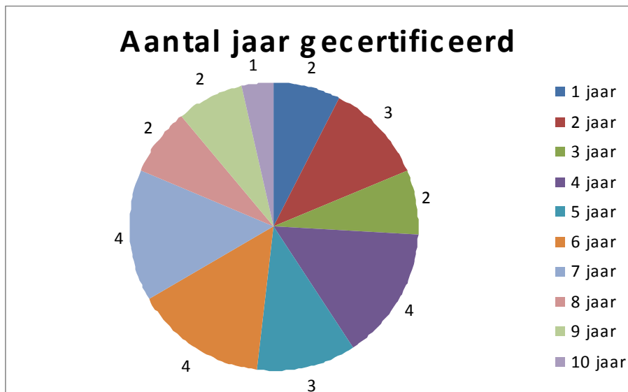
Grafiek 5 Het aantal jaar dat organisaties een ISO 14001-certificaat hebben gehad

Aan de organisaties die op eigen initiatief zijn gestopt met ISO 14001-certificatie is de vraag gesteld hoe groot de kans is dat zij in de toekomst opnieuw gecertificeerd zullen worden. De kans hierop is bij de meeste bedrijven klein: